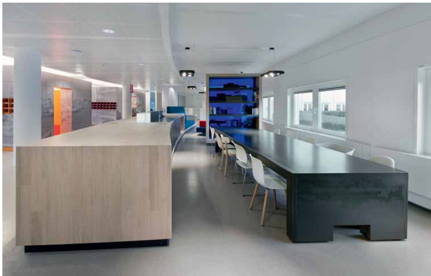
FOTO RECHTSONDER Vergaderruimte in het vergadercentrum.