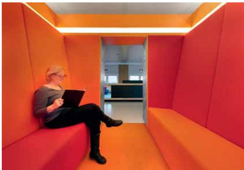
FOTO BOVEN De bank in het restaurant.